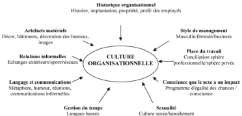
Schéma 1 : Grille de lecture de Rutherford